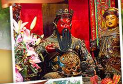
วัดหลิวฟาง