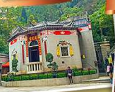
องค์อ้อยส้ม